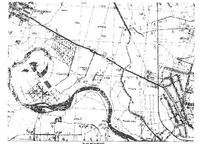
PLAN INCADRARE PERIMETRUL SAMBATENI TERASA II scara 1:25000

Adresa imobil arabil extravilan - comuna Paulis, judetul Arad Nr cadastral: 932, CF 300002 Paulis