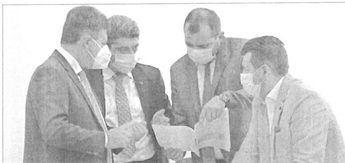
16 membri ai Consiliului de Dezvoltare Regională s-au întâlnit la Arad

Am fost desemnat astăzi vicepreședinte al Consiliului de Dezvoltare Regională (CDR) a Regiunii Vest pentru un