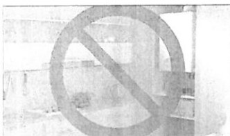
Scopul principal este reducerea semnificativă a emisiilor clădirilor

Pentru a reduce poluarea, mai ales pe perioada sezonului rece, Ministerul Mediului ia în calcul interzicerea instalării de centrale termice de apartament în toate imobilele aflate în construcție. O alternativă ar putea fi centrala de bloc sau racordarea la sistemul centralizat de încălzire, acolo unde acest lucru e posibil.